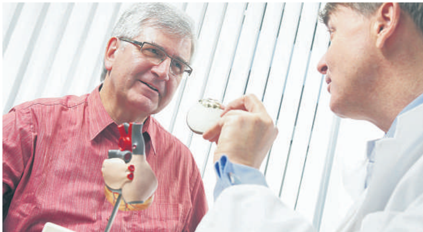
Wenn eine Herzschwäche massiv wird, kann die Implantierung eines Defibrillators die einzige Rettung sein. Was man schon vorher gegen Herzschwäche unternehmen kann, erfahren Sie bei unserer Abendsprechstunde.